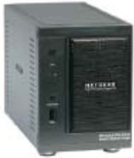
Tamaño pequeño y conveniente para usar en casa (~6x4x9in)

•Ofrece un almacenamiento extra que puede ser aprovechado por todos los ordenadores de la red.